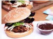
Pulled porc burger