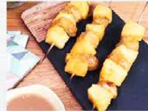
Brochettes façon «saté» à l'ananas et au lait de coco