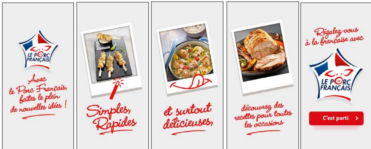
Exemple de bannière Le Porc Français