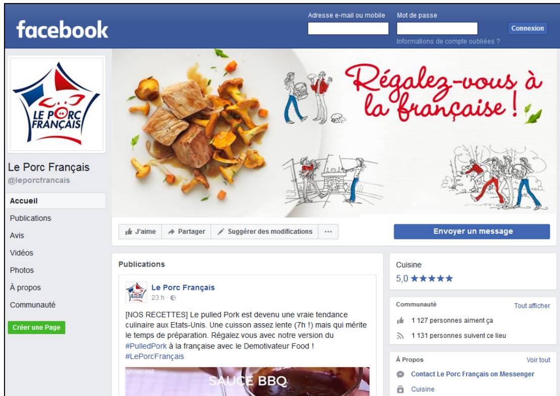
Page Facebook Le Porc Français