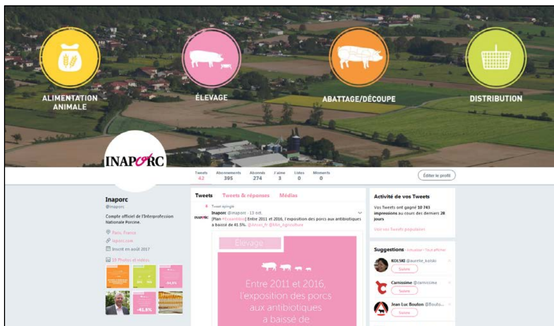
Fil Twitter @Inaporc