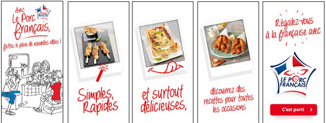
Exemple de bannière cible jeune