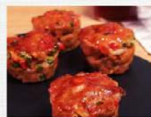
Mini muffins de porc au cheddar