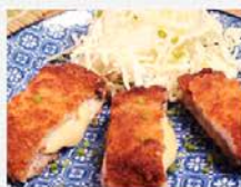
Tonkatsu revisité et son chou sauce tonkatsu